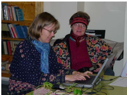
Ravioskorven kyläsuunnitelma etenee

Kuivannon kyläjohtokunnan kanssa aloitettiin kevyt kyläsuunnitelma menetelmän kehittäminen syksyllä 2006. Kuivanto ja Länsi-Hollola päivittivät kyläsuunnitelmansa tulevaisuusosat taulukkomallisiksi mutta päivittivät myös tekstiosan. Hirvisalo-Hujansalon ja Ravioskorven ensimmäiset kyläsuunnitelmat tehtiin suoraan taulukkomallisiksi. Taulukkoon kirjaamisessa osoittautui hyväksi käytännöksi muutaman kyläläisen ja hanketyöntekijän yhteinen työrupeama. Kyläsuunnitelmia valmistui neljä. Suunnitteluprosessin kuvaus laitettiin Päijät-Hämeen kylien www-sivuille, samoin esimerkkisuunnitelmana Länsi-Hollolan kyläsuunnitelma.