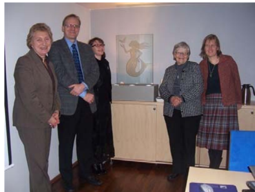
Walesin toimintatutkijat tutustumassa Päijät-Hämeen liittoon ja kuinka sen suunnitteluun on kytketty kyläsuunnitelmat