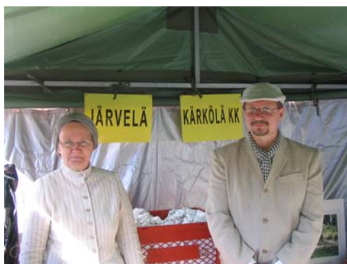
Kyliä kylämarkkinoilla 2007

Kyläyhdistysten ja asukasyhdistysten kohtaamiseksi tehtiin yhteistyötä Vanamo-hankkeen kanssa, mutta tilaisuus peruuntui vähäisten ilmoittautumisen johdosta.