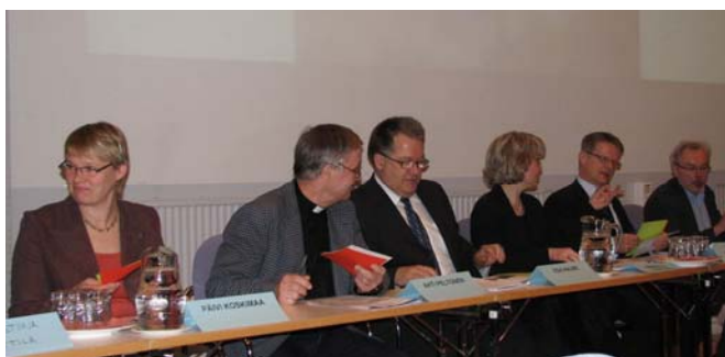
Viimeinen sammuttaa valot? –seminaari