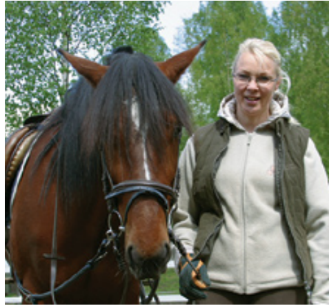
Uraputki vaihtui kaviouraksi

Miksi Urajärvi? Millaista on asua ja elää pienessä maaseutukylässä? Mikä asia sai empimään maallemuuttoa?