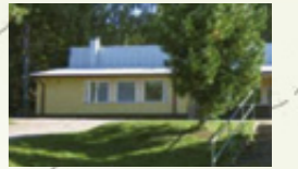
Urajärven koululle matkaa on alle parisataa metriä.